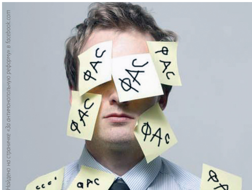
Найдено на страничке «За антимонопольную реформу» в facebook.com

Отметим, что предложения Минэкономразвития лишь отчасти снимут остроту проблемы. На наш взгляд, необходимы не частичные, а полные «иммунитеты» по ст. 10 и 11 135-ФЗ для малого бизнеса. Таким образом, внеплановые проверки этих компаний станут невозможными. Поэтому санкции прокурора на внеплановые проверки необходимо вводить для всех субъектов предпринимательской деятельности.